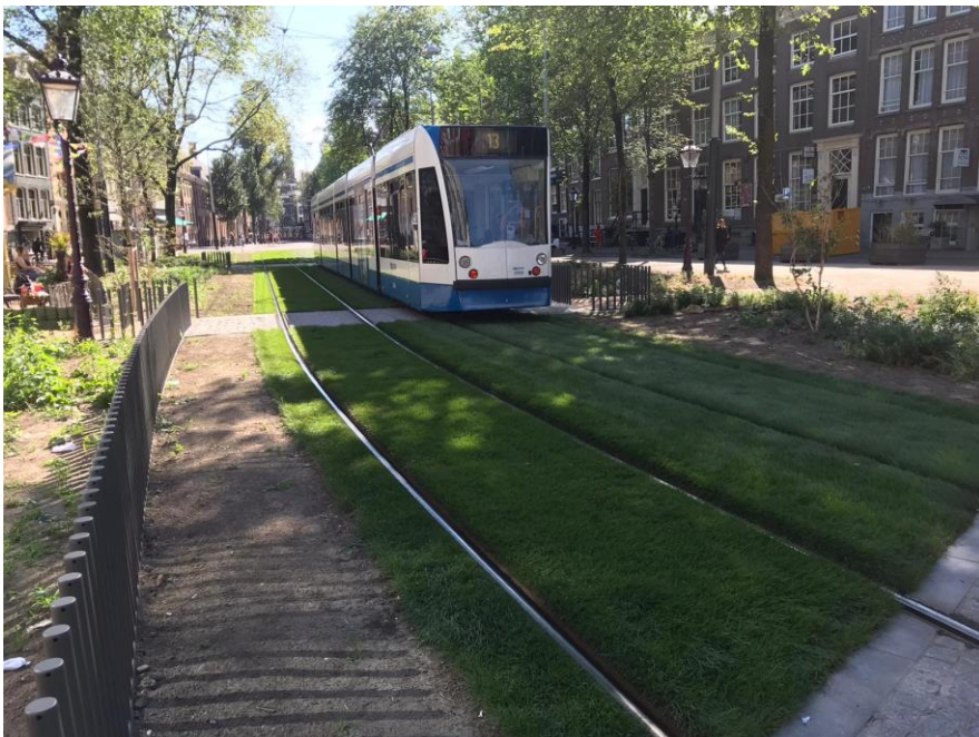
De Postzegelmarkt vernieuwd